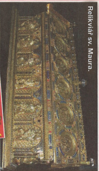
Relikviář sv. Maura.