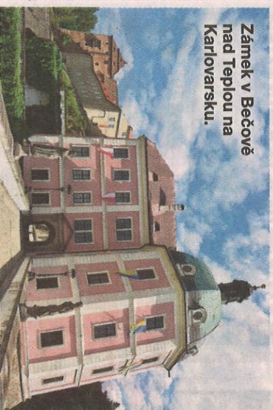
Zámek v Bečově nad Teplou na Karlovarsku.

Zámek v Bečově nad Teplou ukrývá nejen relikviář, ale i nacistické starožitnosti