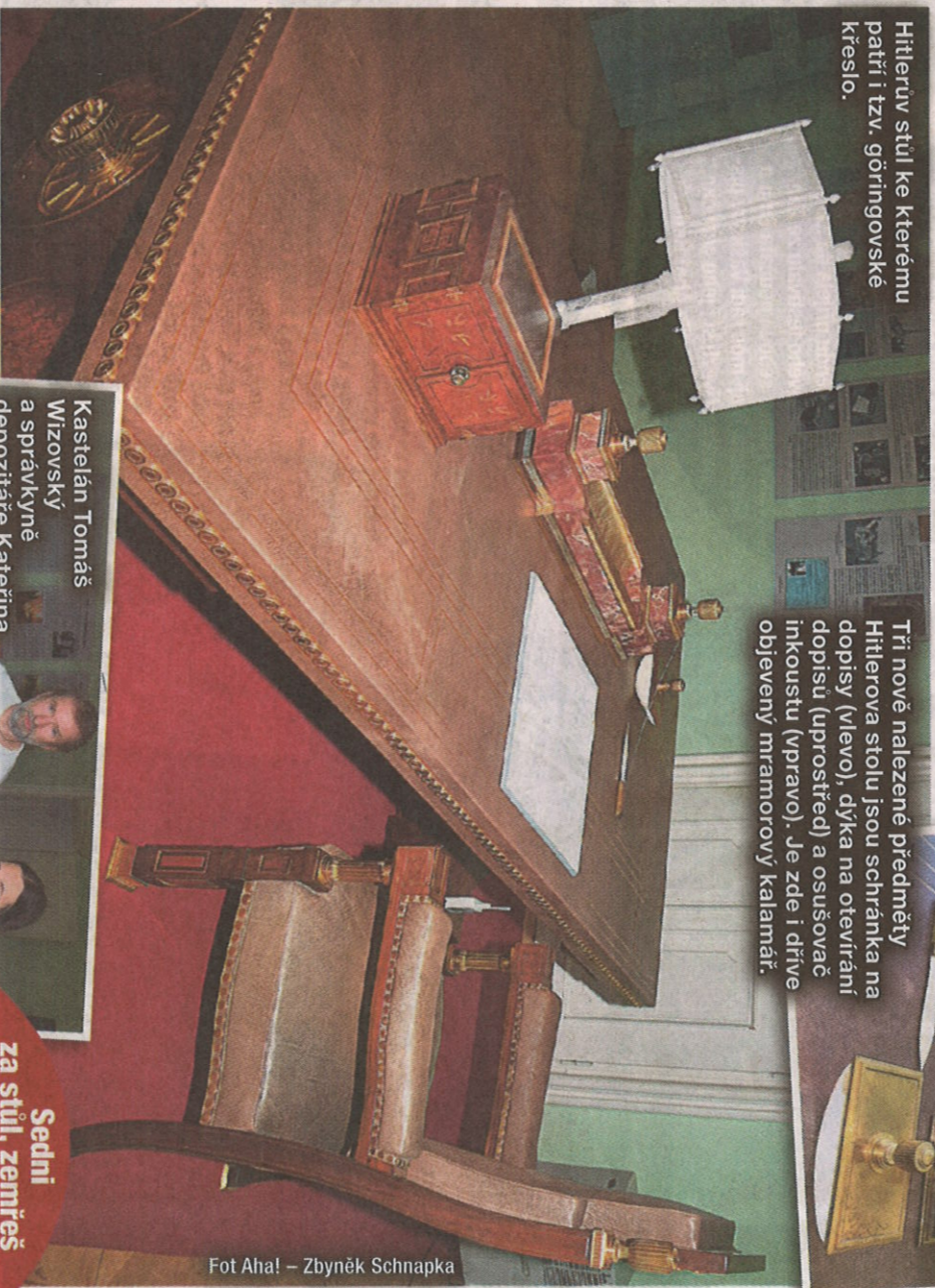
Hitlerův stůl ke kterému patří i tzv. görringovské křeslo.